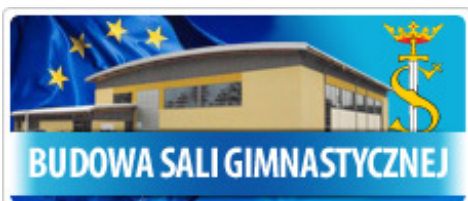
BUDOWA SALI GIMNASTYCZNEJ