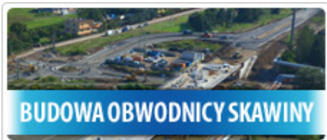
BUDOWA OBWODNICY SKAWINY